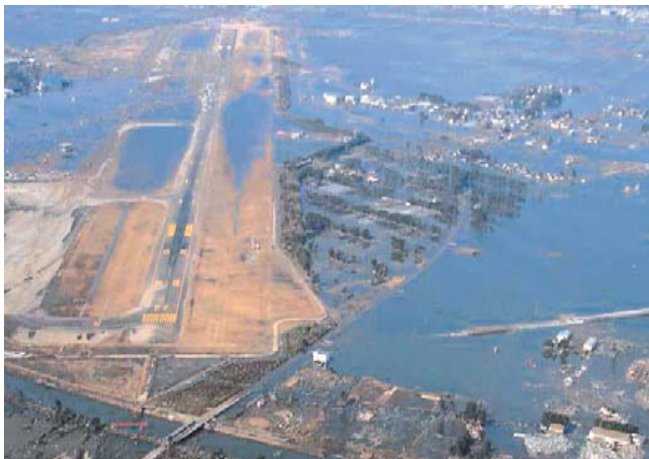
津波により浸水した仙台空港