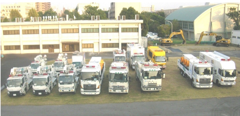
中部技術事務所が保有する災害対策用機械