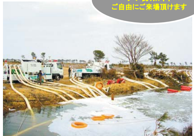
仙台空港での排水作業